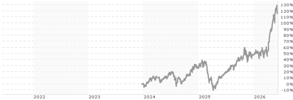
Performanceergebnisse der Vergangenheit lassen keine Rückschlüsse auf die künftige Entwicklung zu.