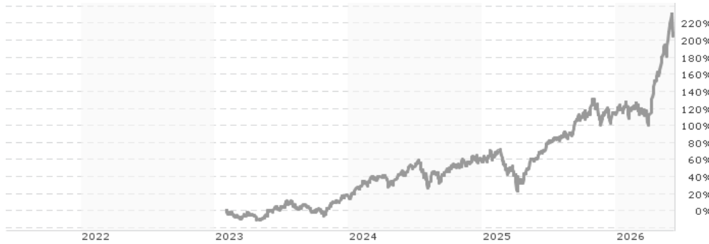
Performanceergebnisse der Vergangenheit lassen keine Rückschlüsse auf die künftige Entwicklung zu.