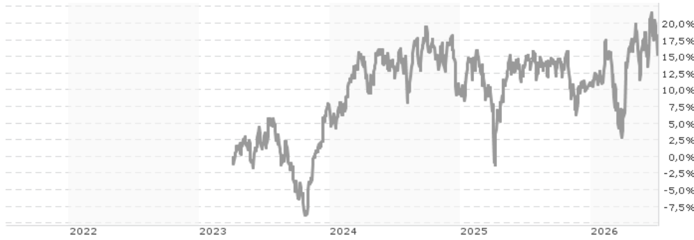
Performanceergebnisse der Vergangenheit lassen keine Rückschlüsse auf die künftige Entwicklung zu.