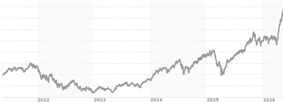
Performanceergebnisse der Vergangenheit lassen keine Rückschlüsse auf die künftige Entwicklung zu.