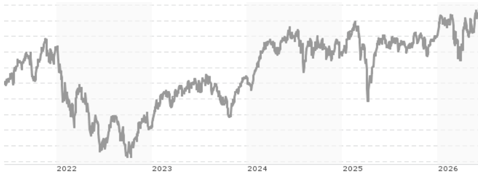
Performanceergebnisse der Vergangenheit lassen keine Rückschlüsse auf die künftige Entwicklung zu.