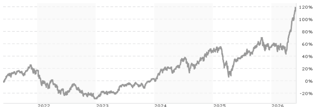
Performanceergebnisse der Vergangenheit lassen keine Rückschlüsse auf die künftige Entwicklung zu.