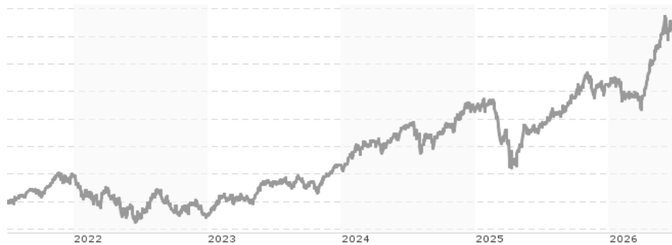
Performanceergebnisse der Vergangenheit lassen keine Rückschlüsse auf die künftige Entwicklung zu.