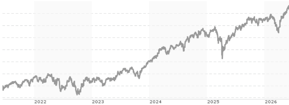
Performanceergebnisse der Vergangenheit lassen keine Rückschlüsse auf die künftige Entwicklung zu.