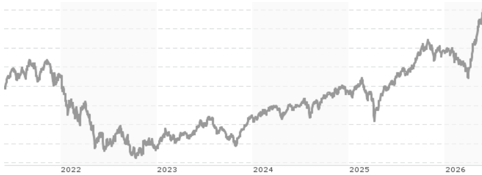
Performanceergebnisse der Vergangenheit lassen keine Rückschlüsse auf die künftige Entwicklung zu.