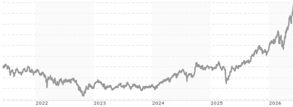
Performanceergebnisse der Vergangenheit lassen keine Rückschlüsse auf die künftige Entwicklung zu.