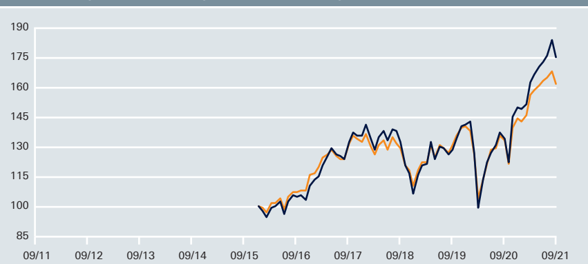
Wertentwicklung – DWS Aktien Strategie Deutschland ID vs. Vergleichsindex*

— DWS Aktien Strategie Deutschland ID — * Vergleichsindex: HDAX (aufgelegt am 11.1.2016=100) Angaben auf Euro-Basis Stand: 30.9.2021