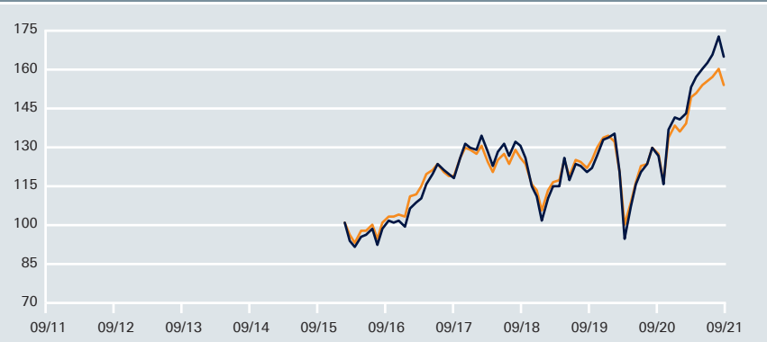
Wertentwicklung – DWS Aktien Strategie Deutschland FC vs. Vergleichsindex*

— DWS Aktien Strategie Deutschland FC — * Vergleichsindex: HDAX (aufgelegt am 4.1.2016=100) Angaben auf Euro-Basis Stand: 30.9.2021