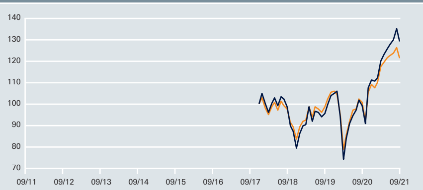
Wertentwicklung – DWS Aktien Strategie Deutschland TFC vs. Vergleichsindex*

— DWS Aktien Strategie Deutschland TFC — * Vergleichsindex: HDAX (aufgelegt am 2.1.2018=100) Angaben auf Euro-Basis Stand: 30.9.2021