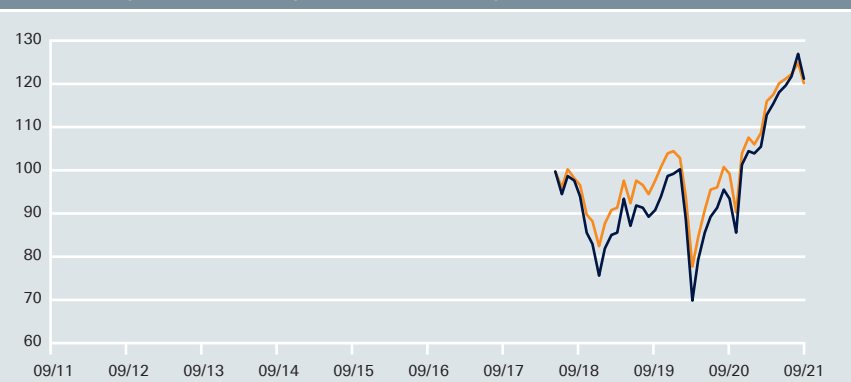
Wertentwicklung – DWS Aktien Strategie Deutschland LD vs. Vergleichsindex*

— DWS Aktien Strategie Deutschland LD — * Vergleichsindex: HDAX (aufgelegt am 11.6.2018=100) Angaben auf Euro-Basis Stand: 30.9.2021