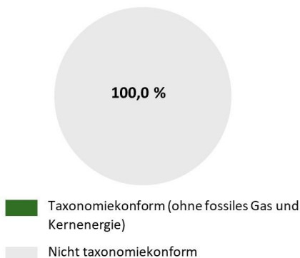
1. Taxonomiekonformität der Investitionen einschließlich Staatsanleihen*